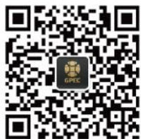
广州私募基金协会