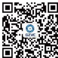
广州创业与风险投资协会